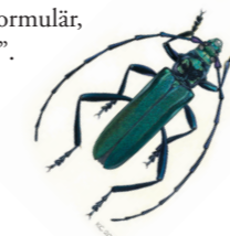
Illustration: Kenneth Claesson

Grupper kan boka guidning på naturum tisdag-lördag året runt. Bokningsförfrågan görs via hemsidans webformulär, www.naturumtakern.se flik "Boka guidning".